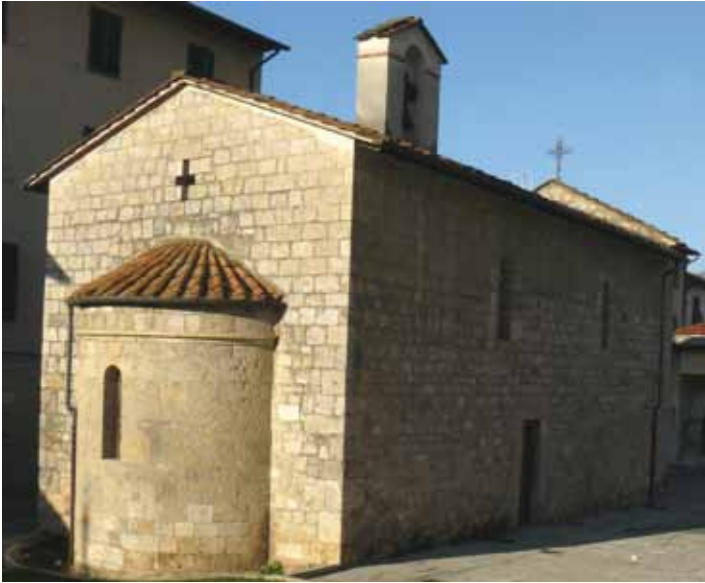
La chiesa di S. Michele