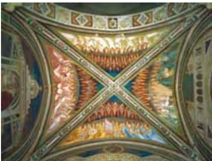
Eremo di San Leonardo al Lago e particolare della volta interna

scorse gli ultimi anni della sua vita e vi morì nel 1309, contribuì a trasformare San Leonardo in meta di pellegrinaggio. Il Monastero conobbe un periodo di grande prosperità grazie alle donazioni di terre e alle offerte dei devoti, nonché al diretto intervento di istituzioni pubbliche, quali l'Ospedale di Santa Maria della Scala e la Repubblica di Siena, che ne promossero il rinnovamento. Fu ampliata la primitiva Chiesetta romanica e realizzata la nuova Chiesa gotica a navata unica, suddivisa in tre campate e abside rettangolare. Tra il 1360 e il 1370, il coro fu interamente affrescato dal pittore senese Lippo Vanni, con ciclo dedicato alla Vergine. Nel locale a pian terreno, originariamente destinato a refettorio, si trova a tutta parete un altro pregevole affresco: la Crocifissione (1445) attribuita a Giovanni di Paolo.