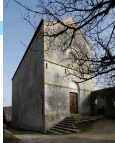
Eremo di San Leonardo al Lago Località Santa Colomba

Orario di apertura: chiuso il lunedì. Aperto (gratuitamente) dal martedì alla domenica dalle ore 9.30 alle ore 15.30 Indirizzo e-mail: sbap-si@beniculturali.it Numero telefonico: 0577 248111 - 0577 248143