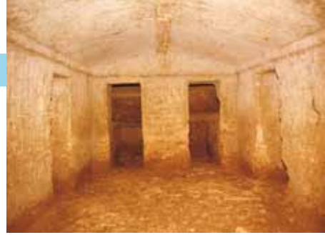
Interno di una tomba a camera di Dometaia

Orario di visita: da luglio a settembre tutti i sabati, le domeniche e i festivi dalle ore 16.30 alle 18.30; da ottobre a dicembre tutte le domeniche dalle 15.00 alle 16.30