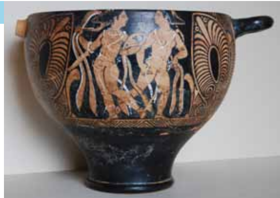
Ceramica etrusca conservata al museo

L'oggetto, trovato in una tomba a camera della necropoli di Dometaia, rappresenta, per stato di conservazione e ricchezza delle decorazioni, uno degli elementi di maggior interesse del sepolcreto ed assieme agli altri elementi del corredo - e ai materiali provenienti dagli altri contesti tombali - concorre ad evidenziare come l'alta Valdelsa, ed in particolare questo settore della regione, fossero percorse, già in epoca etrusca, da importanti direttrici di collegamento, ricalcate in epoca più recente dal tratto sigericiano della via Francigena.