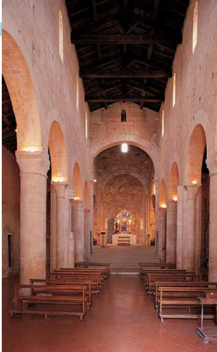
Interno dell'abbazia di Abbazia Isola

Situata a circa 4 km da Monteriggioni, l'abbazia di San Salvatore all'Isola venne fondata nel 1001 dalla contessa Ava, appartenente alla nobile famiglia dei signori di Staggia. Il legame del Monastero con la via Francigena venne sancito fin dall'origine con la scelta della sua collocazione: fu infatti edificato presso la località di Borgonuovo ricordata pochi anni prima da Sigerico, il cui famoso diario di viaggio è riconosciuto come una delle più antiche testimonianze del percorso della via Francigena. La posizione del Monastero ne determinò la funzione di luogo di ospitalità per pellegrini e viandanti, che fu particolarmente attiva soprattutto nei primi secoli successivi alla fondazione.