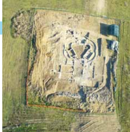
La Torraccia di Chiusi

scavi, con la possibilità di visita dell'area (ore 8.00 – 17.00); nei restanti mesi dell'anno il sito non è accessibile, ma è dotato di apposita pannellonistica esplicativa esterna. Si trova in terreno di proprietà privata